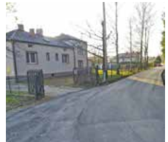
Przysieki - Tłoki