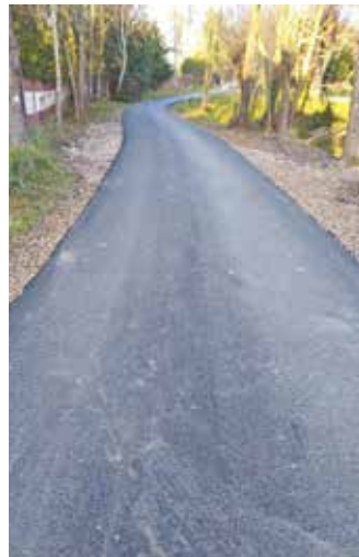
Skołyszyn - Wieś