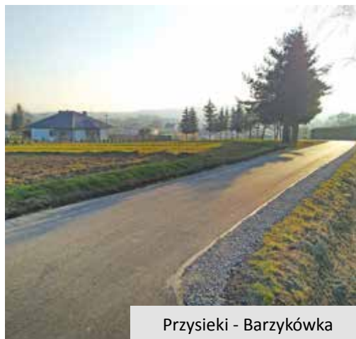
Przysieki - Barzykówka