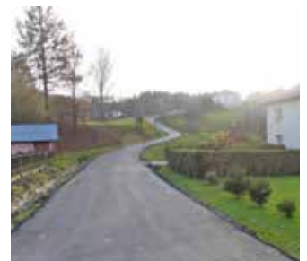
Jabłonica - Zadębina