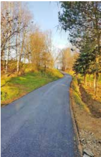
Świącany - Psiny