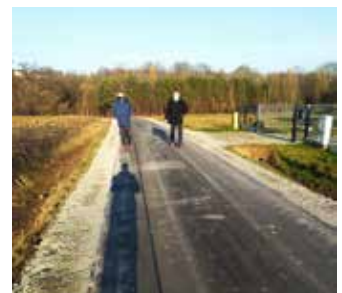
Przysieki - Barzykówka